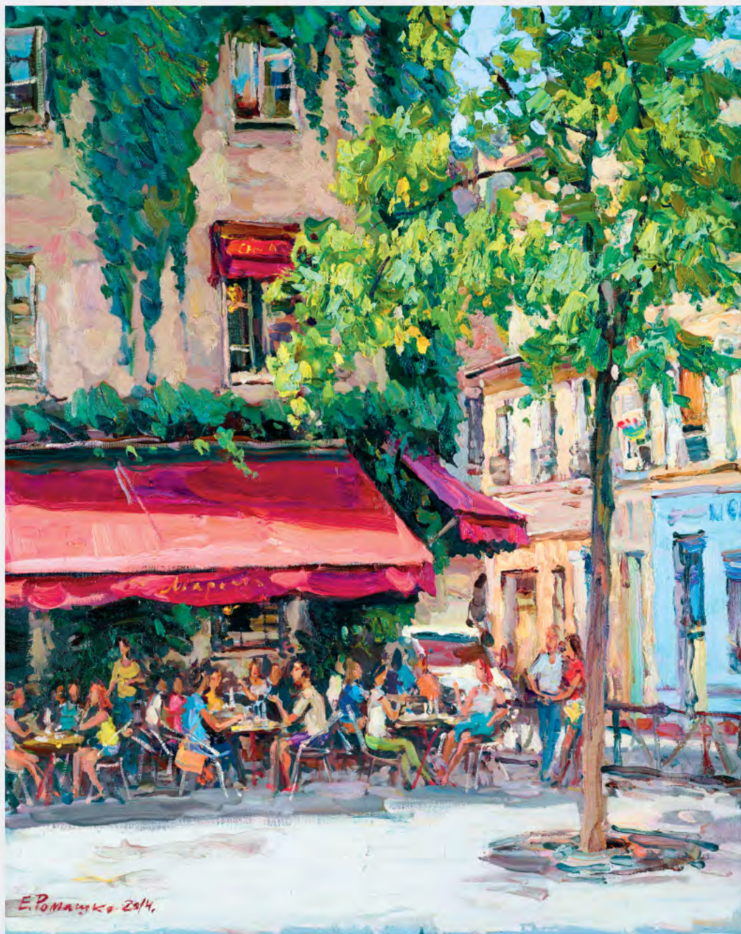
Старое кафе на улице Розе в Париже 2014 х.м., 100x80