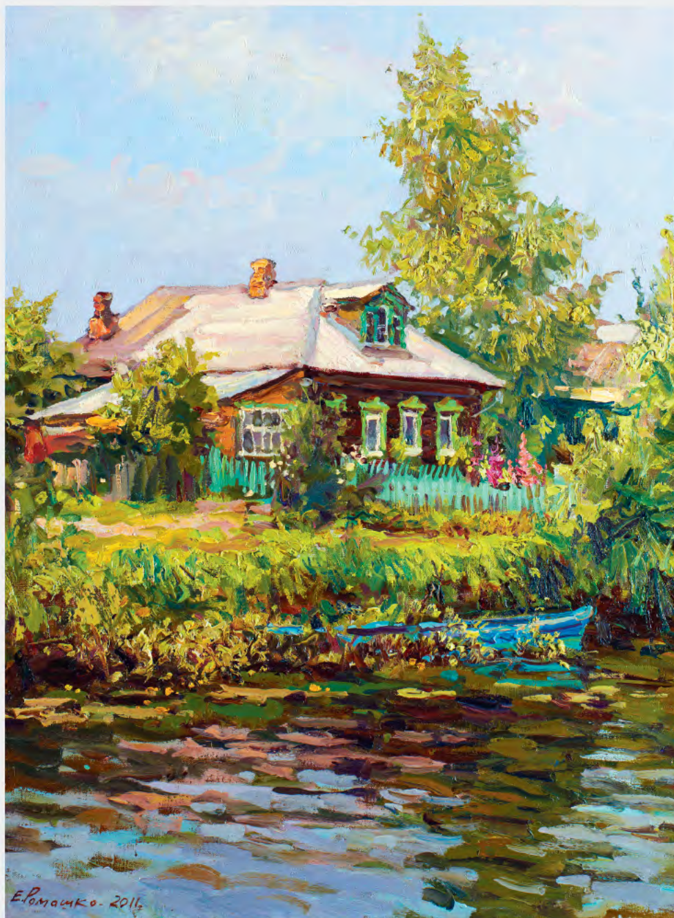
Дом на Трубеже