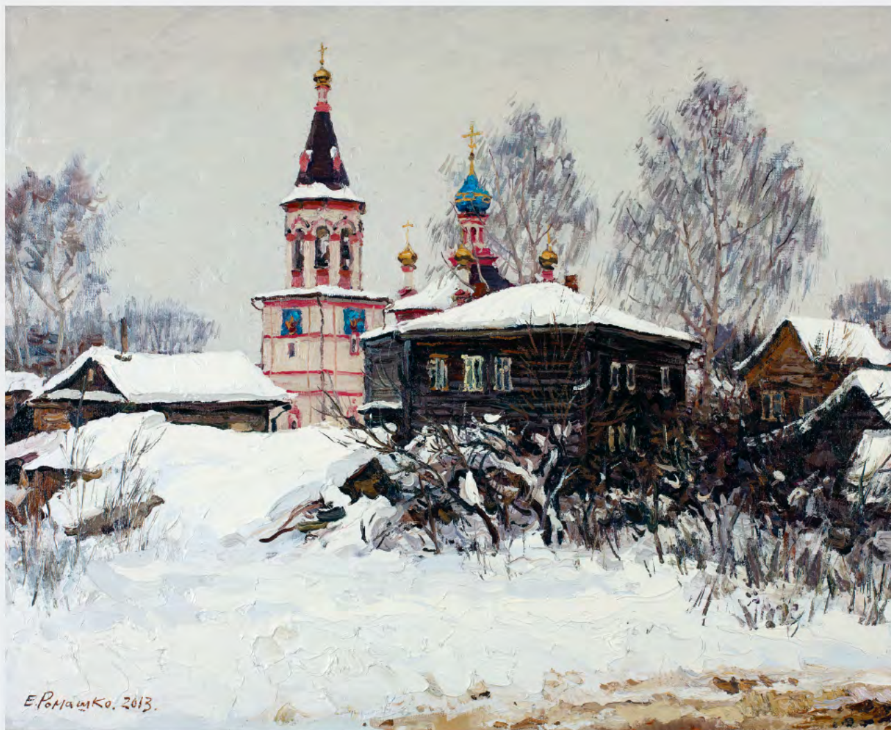
Зимой в Переславле 2013 х.м., 90x120