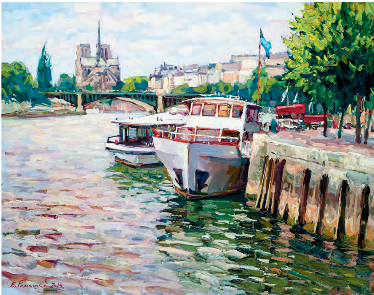
В районе Бастилии 2014 х.м., 89x116