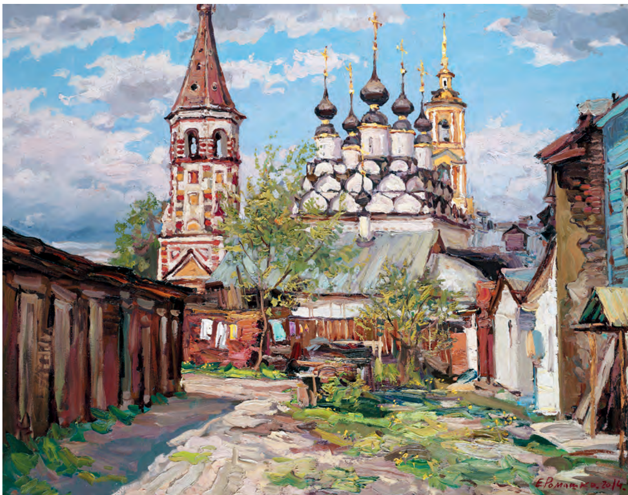
Русский мотив 2014 х.м. 95x120