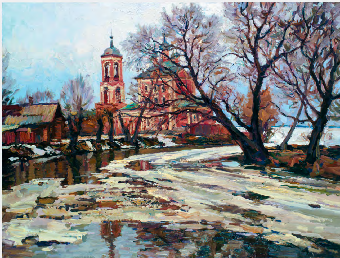
Ледоход на Трубеже