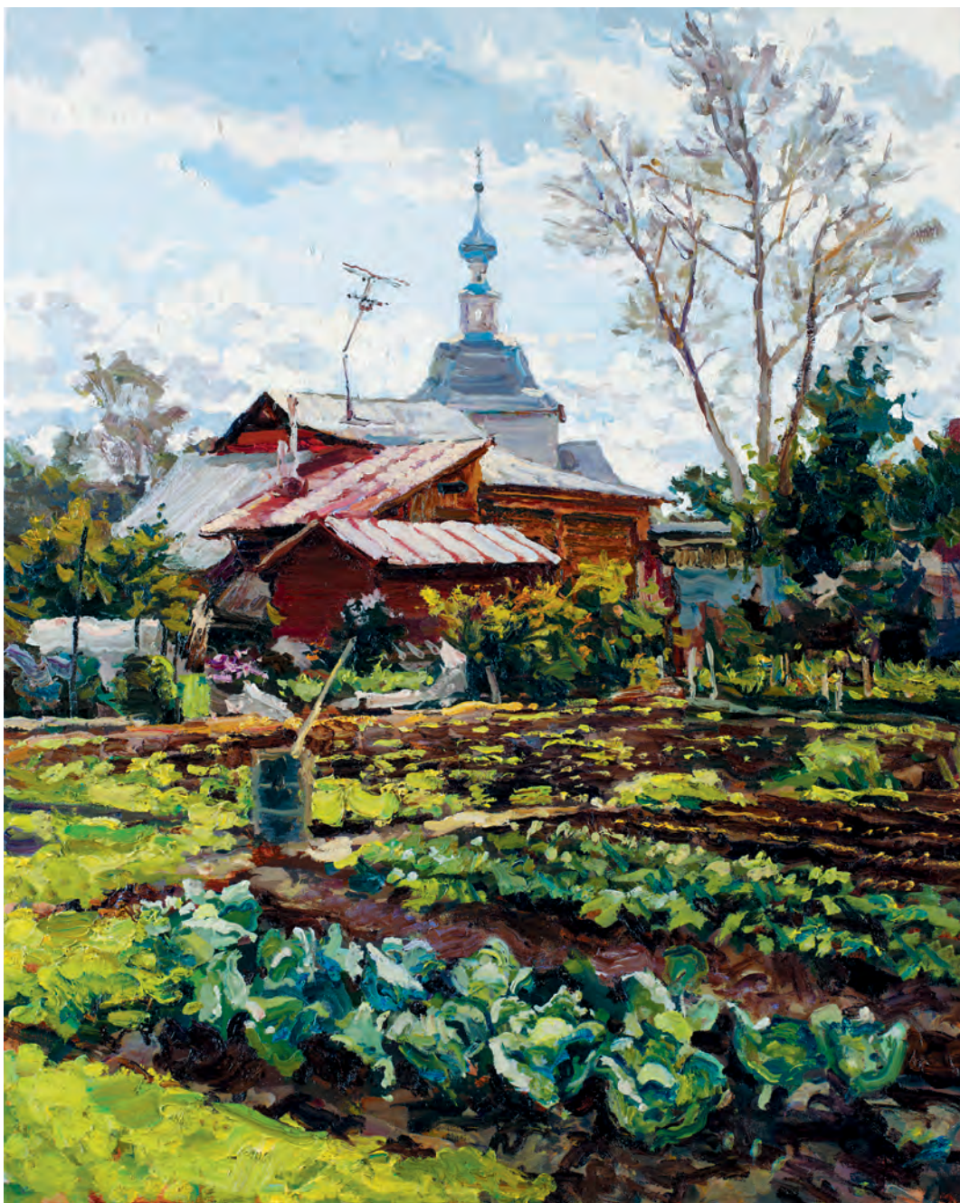
Огород хозяйки 2012 х.м., 100x80