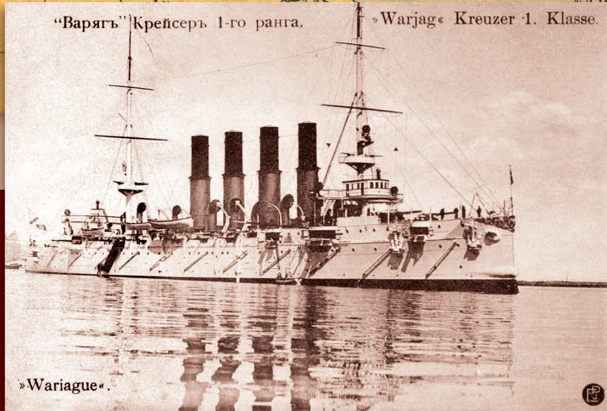
«Варяг» Крейсер 1-го ранга. «Warjag» Kreuzer 1. Klasse.