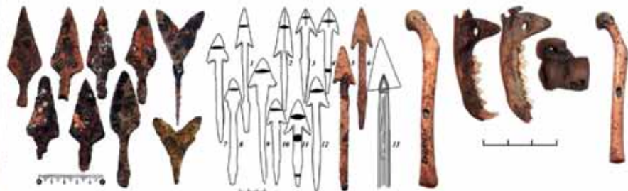
Охотничьи железные наконечники стрел (ромбовидные и 2 срезня на водоплавающих птиц). Железные наконечники самострелов. Амулеты и манки из костей