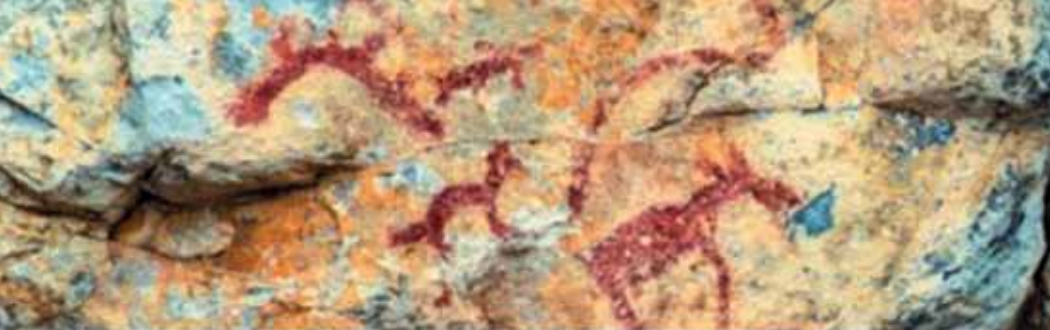
Фрагмент росписи Писаного Камня