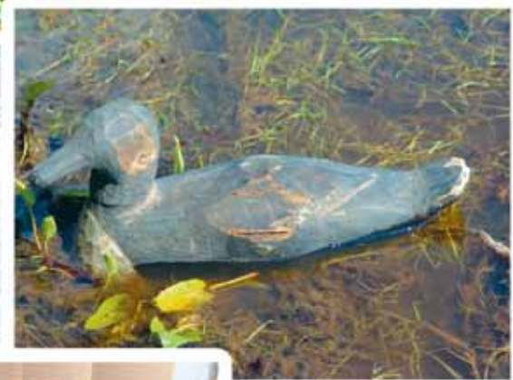
Утка-ману, манишка. XX в, г. Усолъе, УИАМ, КП №57-14