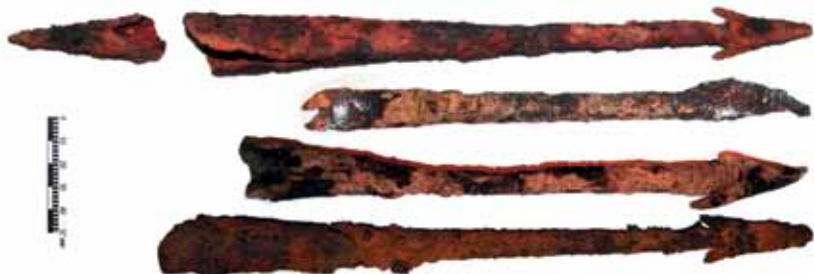
Железные охотничьи копья-рогатины и вток (на нижний конец древка)