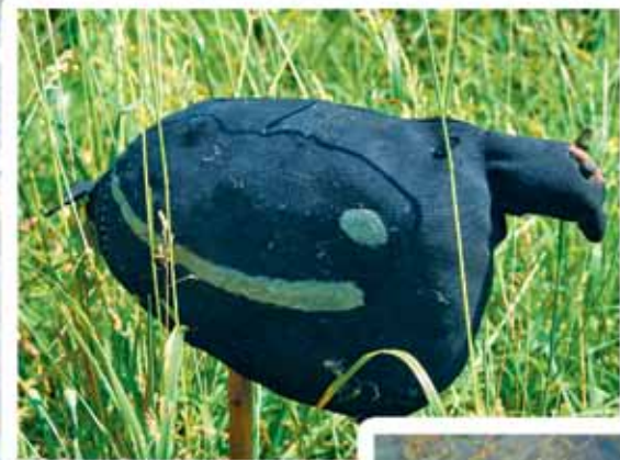
Чучело тетерева-косача. XX в, г. Усолъе, УИАМ, КП №57-13