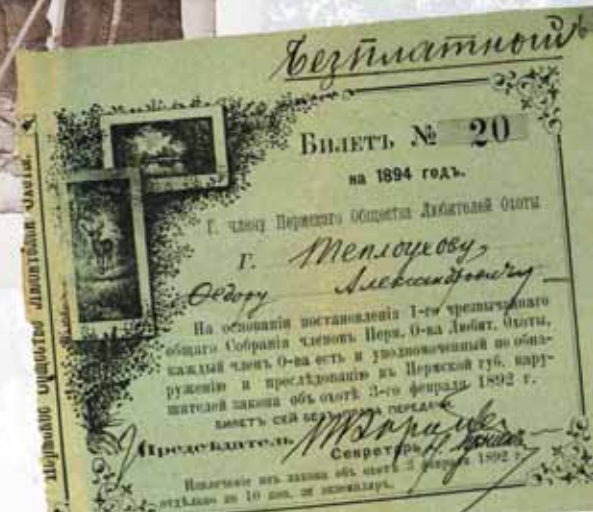
Общество охотников, г. Соликамск