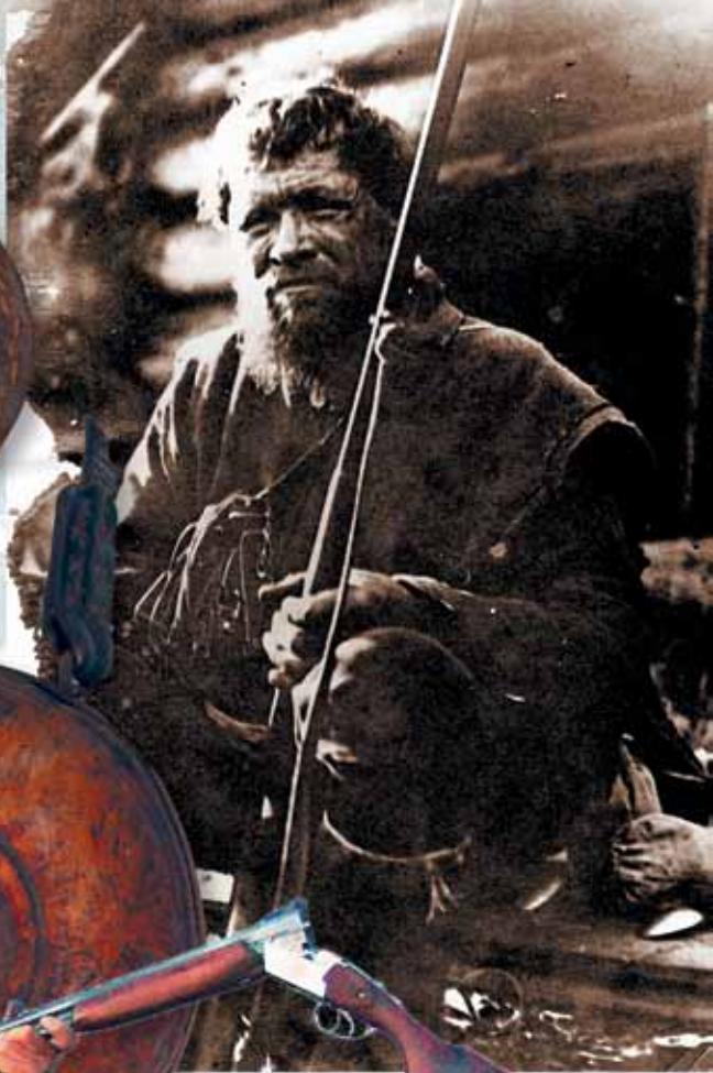
Охотник. УИАМ Красновишерск