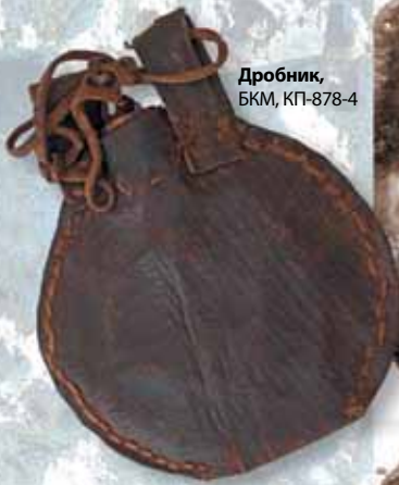
Дробник, БКМ, КП-878-4