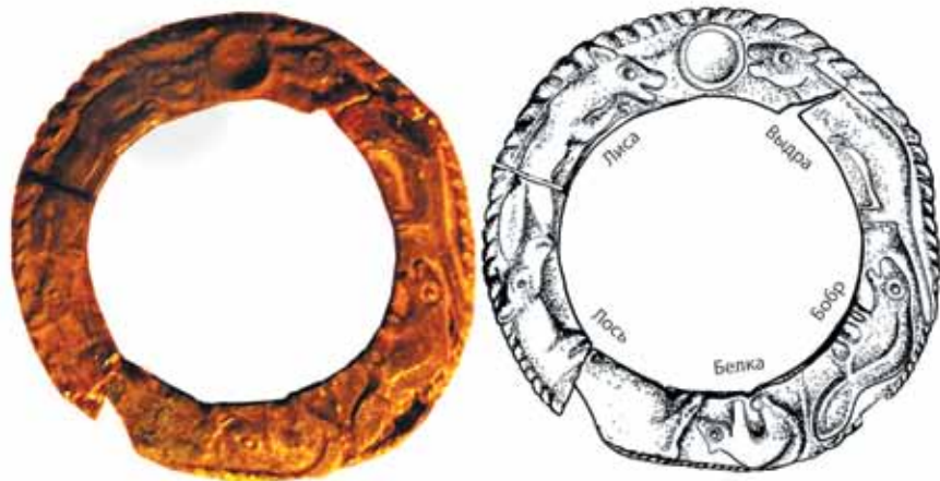
Промысловый календарь, Соликамск