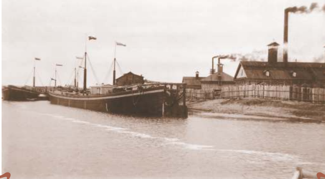
6. г. Дедюхин. Баржи при выходе из канала.

Для подхода к соляным амбарам в Дедюхине были обустроены два канала, имевшие выход к руслу Камы и Чашкинскому озеру. Фото кон. XIX в.