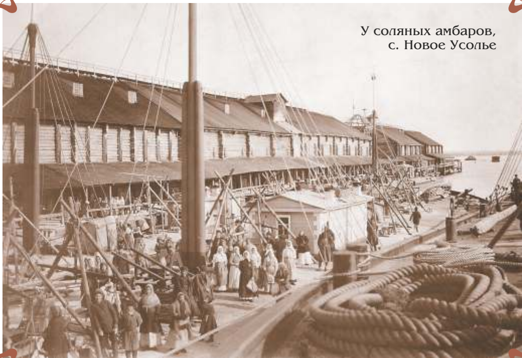
16. с. Новое Усолье. Погрузка соли.

В короткий сезон весеннего половодья на промыслы приходило большое число пришлых работников. При продолжительном световом дне погрузка велась почти круглосуточно. Фото нач. XX в.