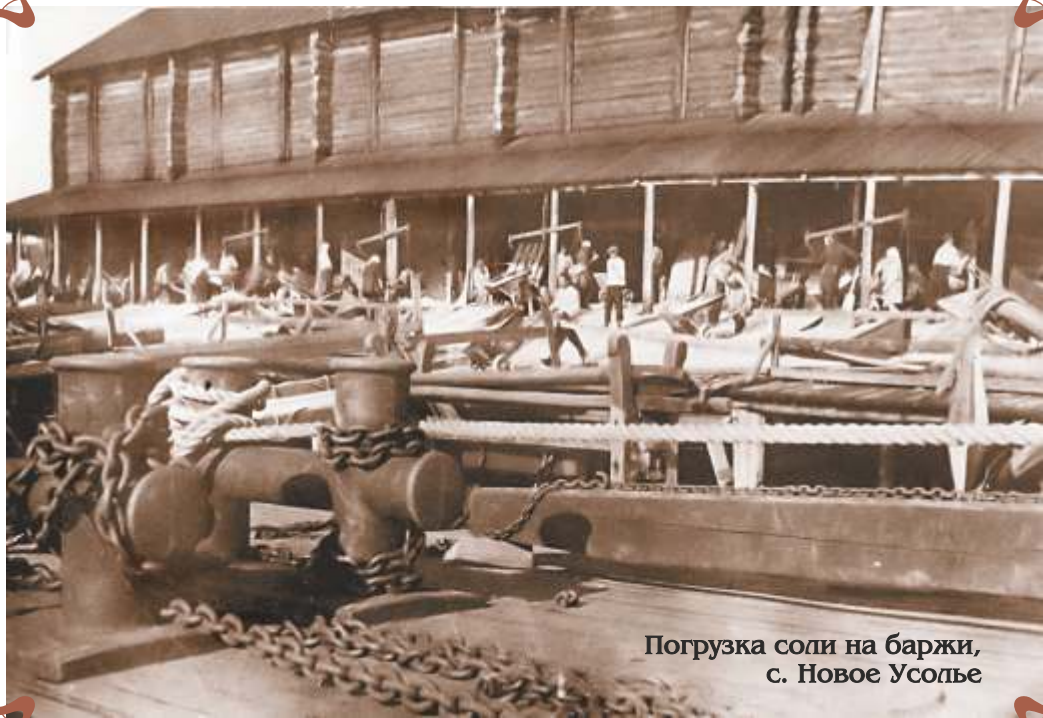
Погрузка соли на баржи, с. Новое Усолъе

8. с. Новое Усолъе. Погрузка соли в баржу.