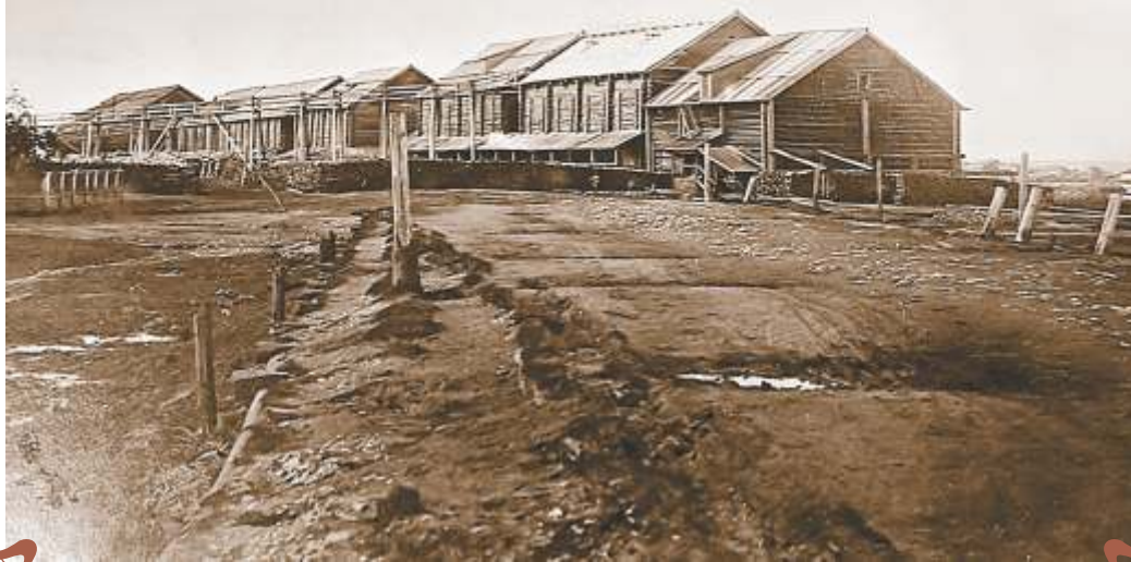
9. с.Новое Усолье. Соляные амбары.

На фотографии 1880 г. из альбома С.М. Голицына непрерывная цепь амбаров вдоль берега даёт представление об огромном количестве соли, вывариваемой на соляных промыслах Усожья.