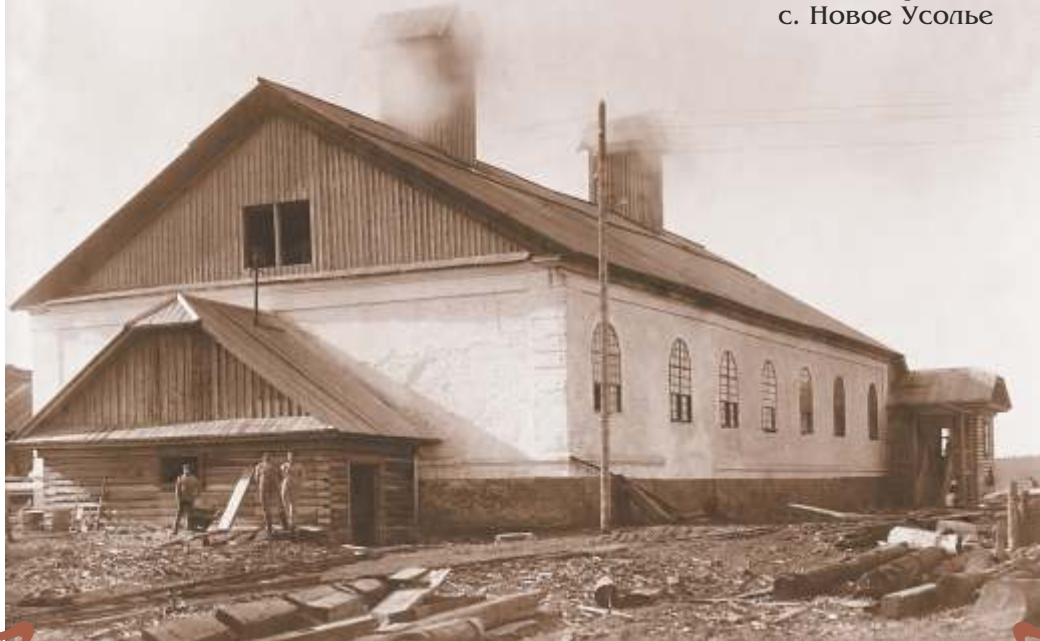
2. с. Новое Усолье. "Белая" каменная варница.

После большого пожара 1809 г. сользаводы Усожья подвергаются коренной реконструкции. Впервые здесь возводятся каменные солеварни "по белому", поставленные на высокий цоколь. Стиль классицизм определяет их внешний облик. Фото нач. XX в.