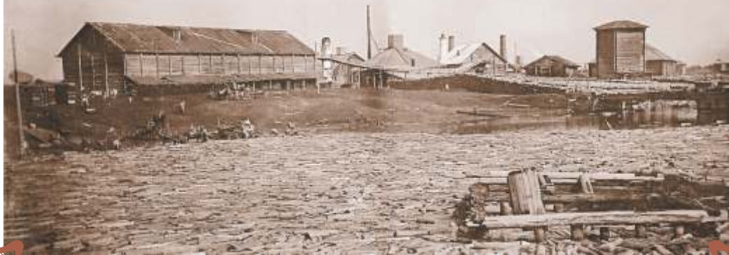
14. с. Новое Усолъе. Сплав дров.

В период весенних паводков заготавливаемые дрова сплавляли по малым рекам: Яйве, Кондасу, Вишере, Зырянке к солеваренным промыслам. Фото 1911 г.