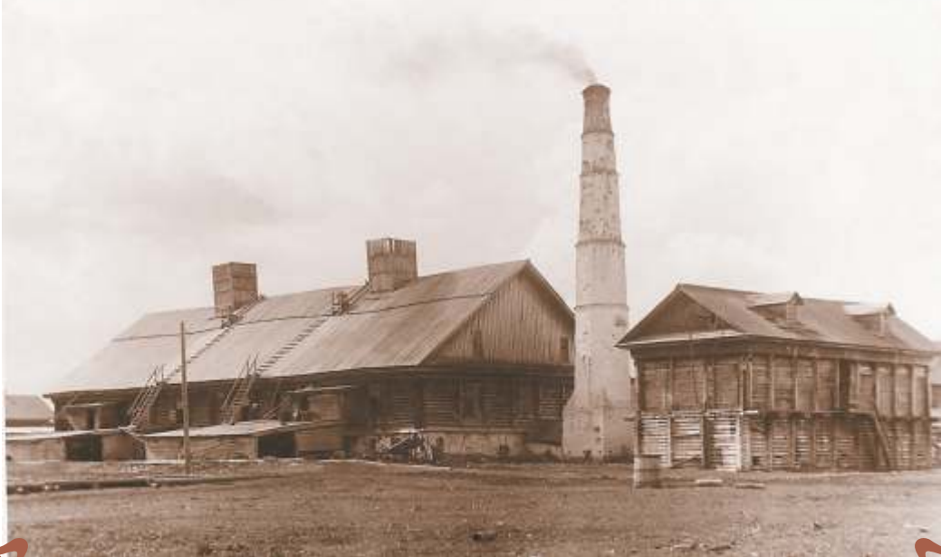
13. с. Новое Усолье. Солеварня на два цирена. Соляной ларь.

Соляной рассол из недр поступал в ларь, где отстаивался и насыщался, и в концентрированном виде по деревянным трубам направлялся в варницы. Фото 1911 г.