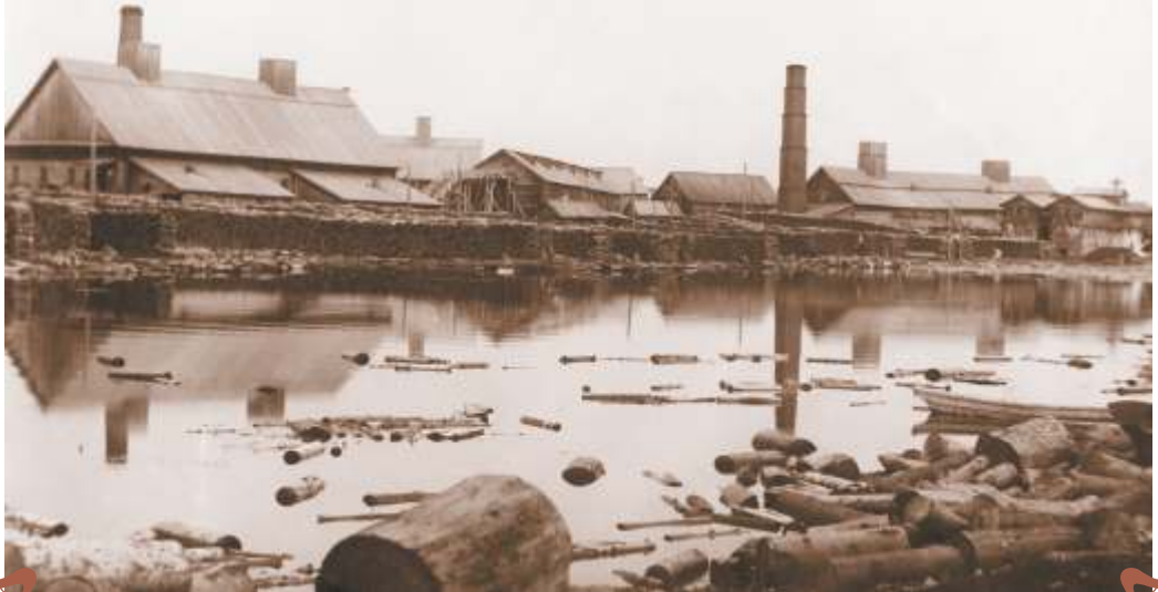
1. с. Новое Усолье. Сользавод в период наводнения.

"Усолье расположено в месте низменном и весной ежегодно подтопляется полою водой". С начала XIX в. строятся новые варницы "по белому". Для предохранения от подтопления их воздвигают на подсыпном основании. Фото 1911 г.