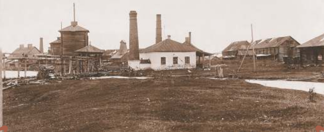
11. с. Лёвинское. Вид на солеваренный завод.

В числе традиционных промысловых сооружений с начала XIX в. появляются новые типы каменных зданий: кузницы, лесопильни, столярки. Фото 1907 г.