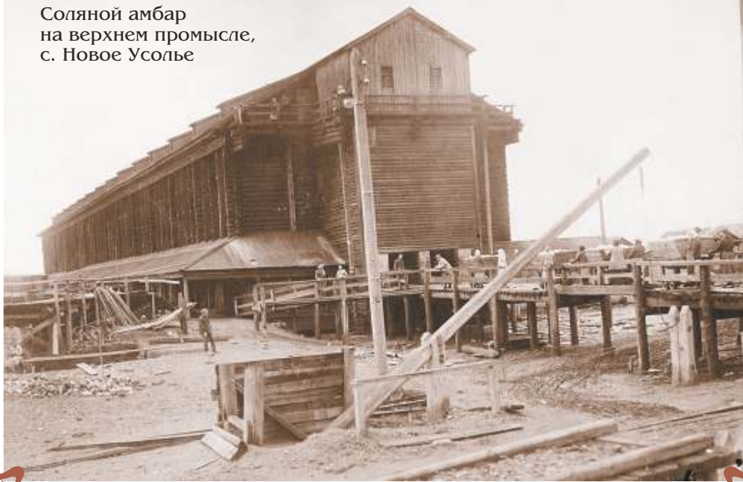
7. с. Новое Усолье. Соляной амбар.

Соляной амбар: грандиозное по своим масштабам сооружение, строившееся исключительно из дерева. Высота амбара достигала иногда 10-15 м. Строили, как правило, на сваях со стороны реки. С противоположной стороны амбар имел наклонные въезды, что позволяло производить засыпку соли сверху. Фото 1911 г.