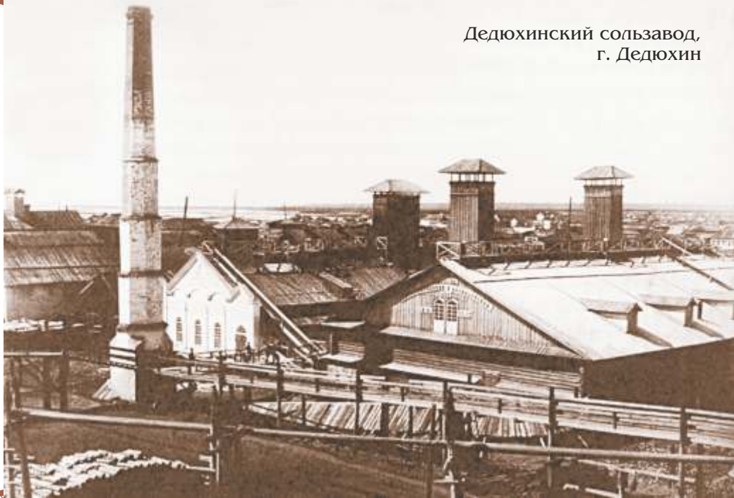
3. г. Дедюхин. Вид на солеваренный завод.

Казенный солеваренный завод г. Дедюхина, расположенного на левом берегу Камы, занимал пространство между двумя каналами. В XIX в. здесь строятся совершенные по тому времени солеварни на 2-3 цирена; печи с оборотами обладали большой теплоотдачей. Фото нач. XX в.