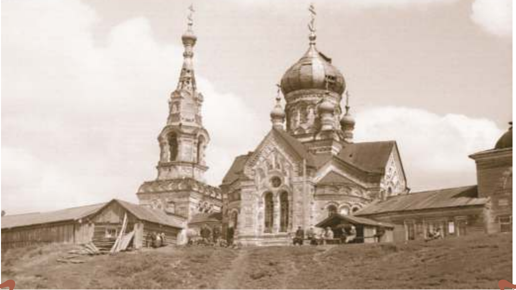
б. с. Таманское

Церковь Петра и Павла, 1910-1912 гг. Архитектор А. Турчевич (?)