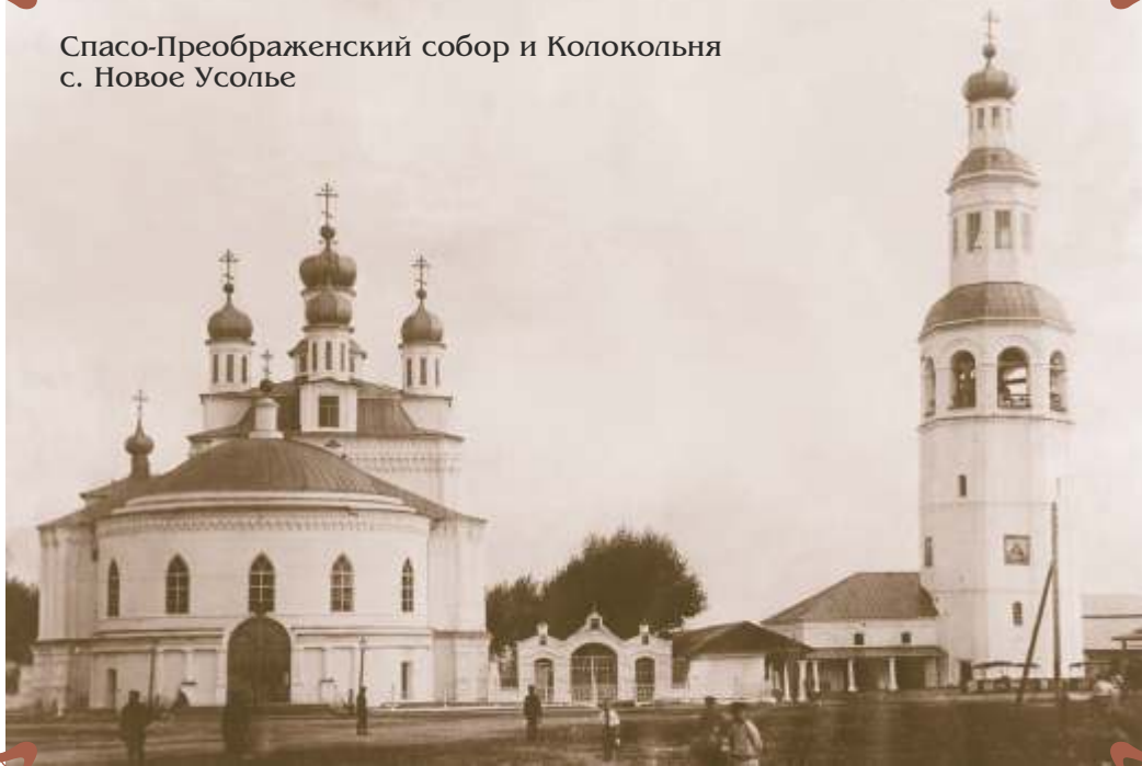
8. с. Новое Усолье

Спасо-Преображенский собор, 1724-1731 гг. Колокольня, 1730 г. Ротонда, 1820 г. Архитектор И. Белоногов. Собор основан Сергеем Григорьевичем Строгановым в благодарность за пожалованный императором Петром I титул барона. Последняя в ряду строгановских церквей, построенных в традициях "московского" барокко с краснокирпичными фасадами и беленым изысканным декором. До постройки Спасской церкви, как она первоначально именовалась, здесь существовала деревянная Казанская церковь "тремя шатрами вверх". Колокольню строили "соликамские каменщики Рязанцев, Котельников, Кожин со товарищи". Первоначально венчалась высоким шпилем, который после пожара 1842 г. не восстанавливался.