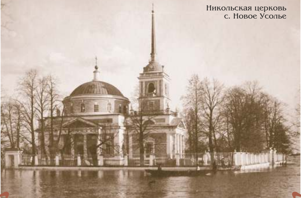
10. с. Новое Усолье

Никольская церковь, 1813-1820 гг. Архитектор А. Воронихин (?) Памятник Отечественной войне 1812 г. Построена на средства барона Григория Александровича Строганова на месте сгоревшей деревянной Покровской церкви. Крестово-купольный храм с колокольней в виде триумфального столпа с куполом и шпилем. Рядом с церковью расположена могила строгановского историка Ф. Волегова. Надгробие могилы, уничтоженное в начале 30-х гг. прошлого века, восстановлено в 2006 г. Ныне церковь восстанавливается.