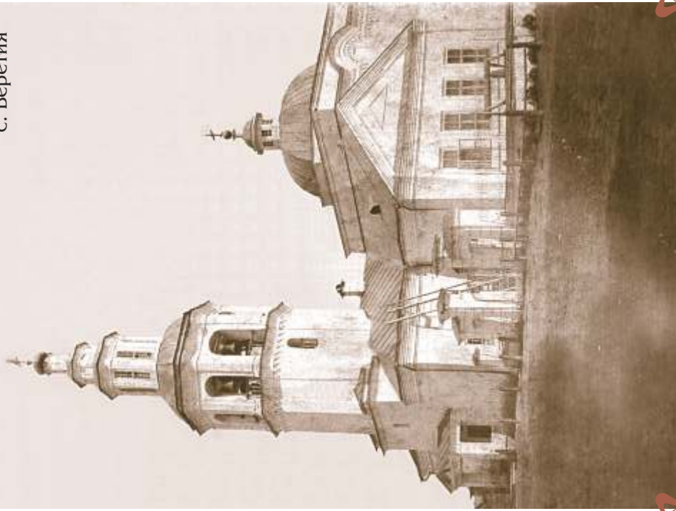
13. с. Веретия

Свято-Троицкая церковь, 1746 г. Построена иждивением баронов Строгановых в благодарение Бога и Государя за дарованный в 1722 г. титул баронов, с Петропавловским и Борисоглебским приделами. Была известна как хранилище строгановских вкладов с иконами царских изографов и книгами старого письма. Разрушена полностью в 1954 г. Ныне – остановка автобуса "Азот".